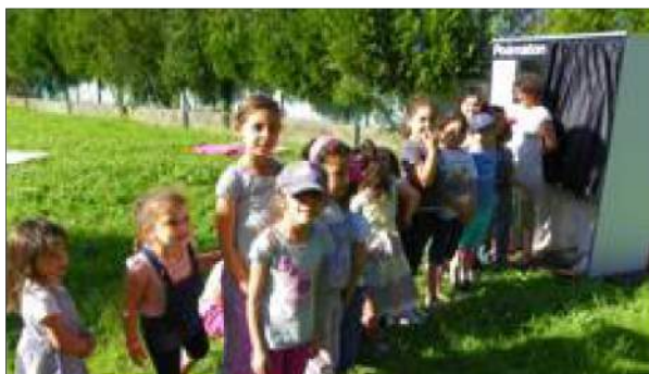
■ Les plus jeunes ne boudent pas la cabine Poématon.

Vendredi, la poésie et le cirque se sont installés rue Jeunet. La cabine « Poématon » invitait enfants, ados et parent à écouter les poèmes sélectionnés par la