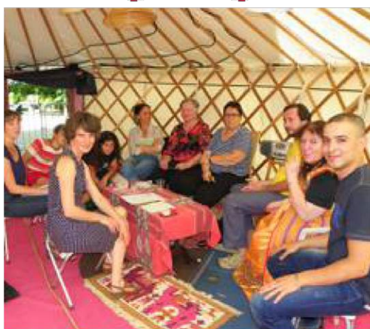
■ Dernier briefing pour les comédiens amateurs et pros.